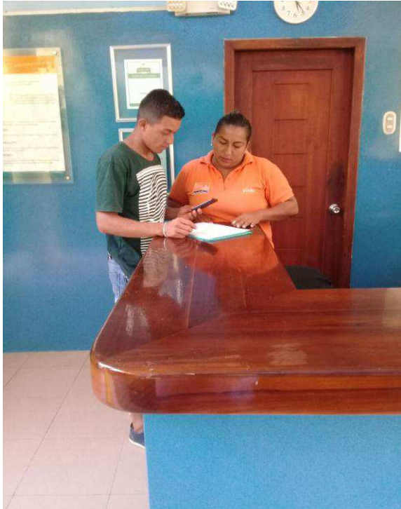
Entrevista aplicada recepcionista Hotel Canoa's Wonderland