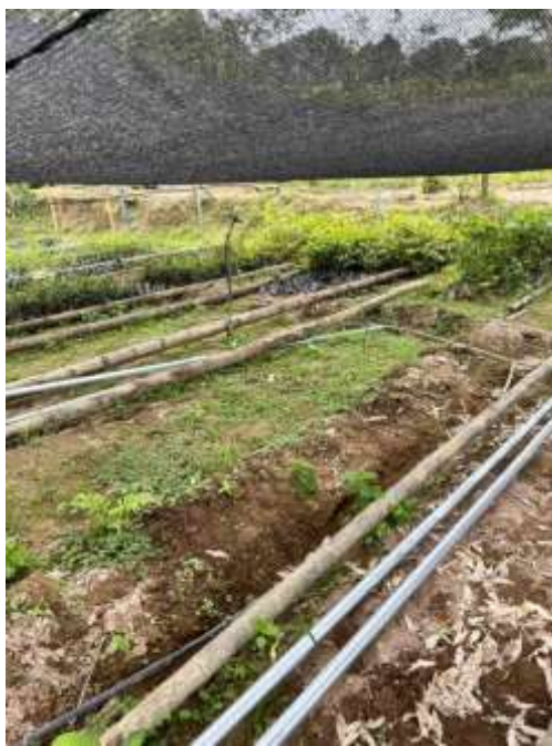
Ilustración 6 Vistas del vivero experimental de pachaco durante las etapas de preparación y establecimiento.