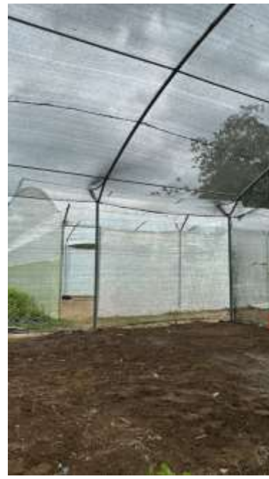
Ilustración 5 Macro túnel experimental con cobertura de malla sarán al 35% para el ensayo de pachaco.