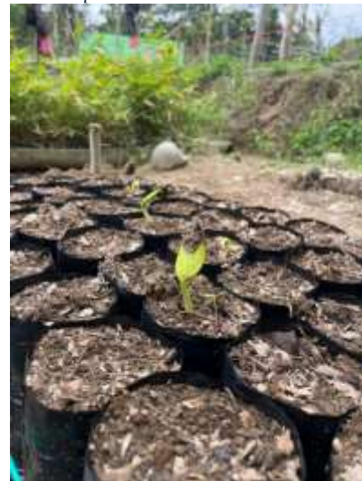
Ilustración 3 Plántulas de pachaco ( Schizolobium parahyba ) en etapa de desarrollo (7 días post-siembra).