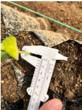
Ilustración 2 Medición de altura de plántula de pachaco con calibre digital durante evaluación a los 15 días.