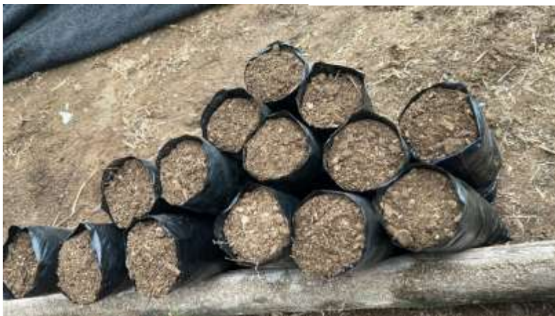
Ilustración 4 Fundas plásticas preparadas con sustrato para el trasplante de plántulas de pachaco.