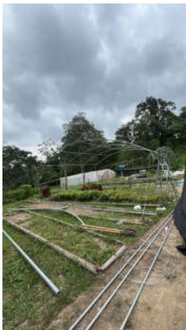
Ilustración 7 Vista general del vivero experimental.