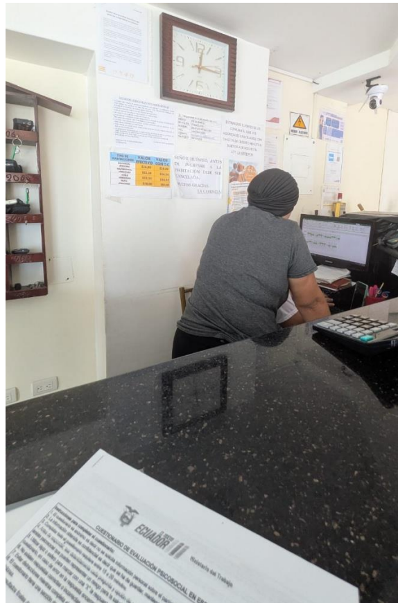
Anexo 10. Aplicación de cuestionarios por parte de la investigadora a los trabajadores de los Hostales.