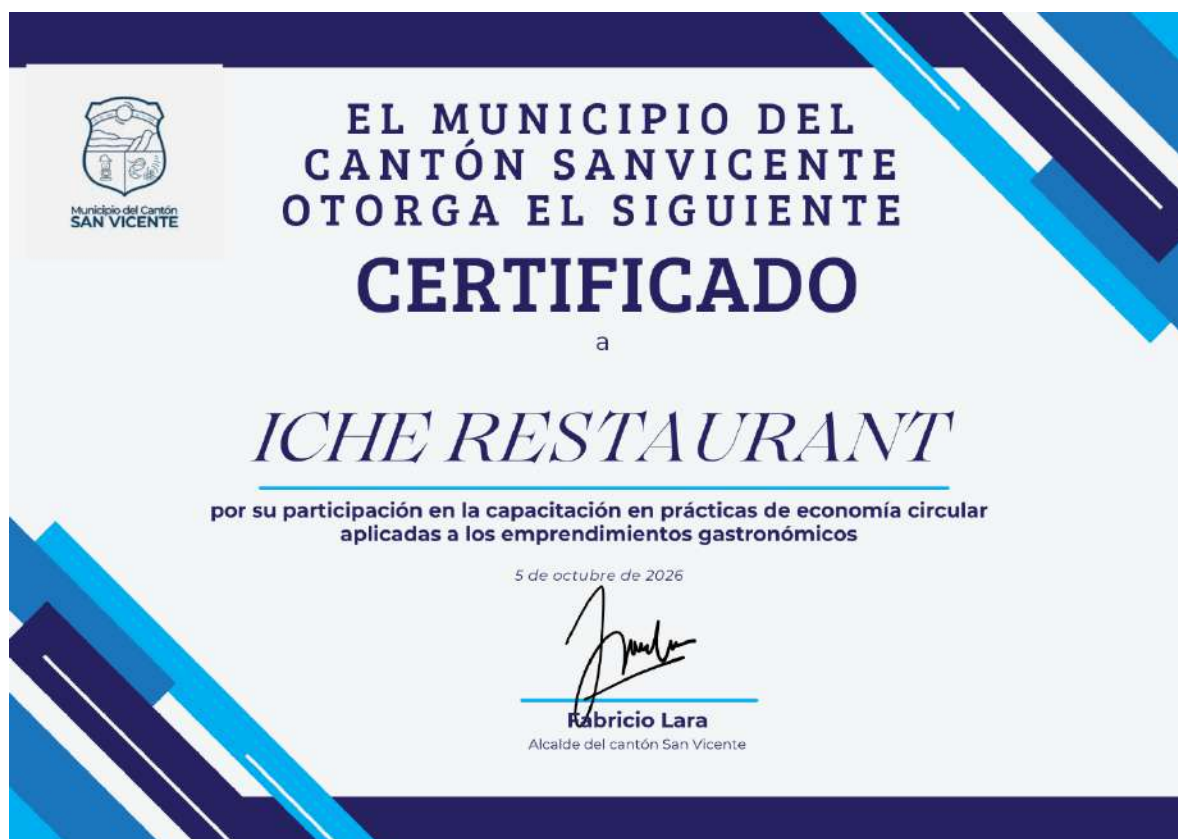
Ilustración 1 Diseño de propuesta certificado de reconocimiento