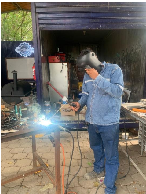
Ilustración 6 soldando las platinas para los muñecos