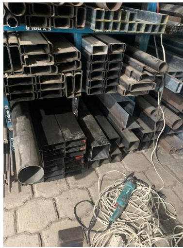
Ilustración 1 compras de perfiles de acero