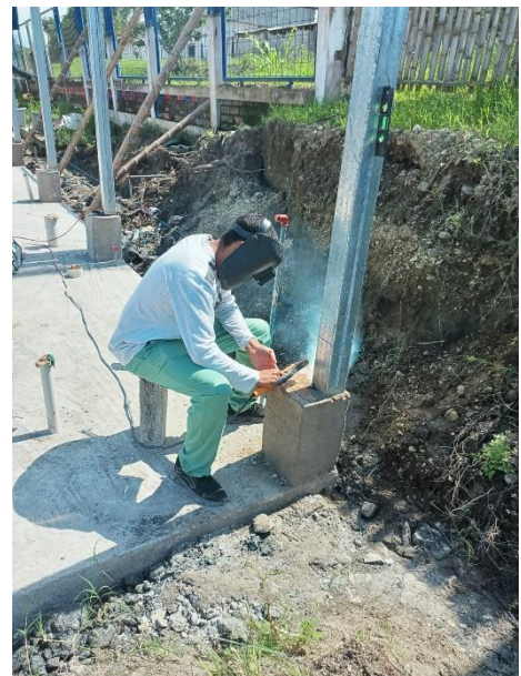
Ilustración 7 soldando las columnas de acero