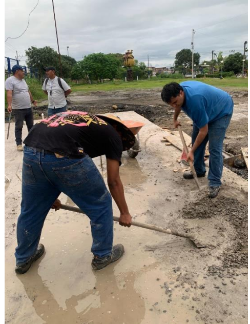
Ilustración 4 mezcla de concreto para los muñecos