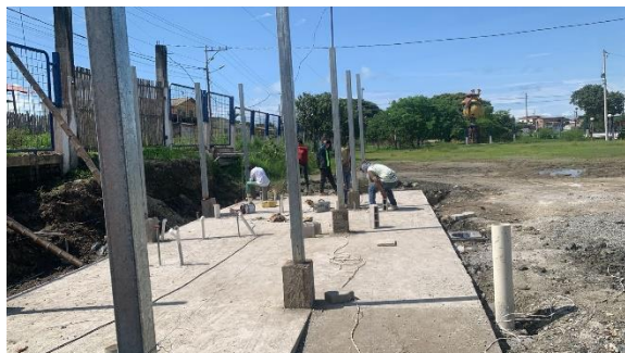
Ilustración 2 estructura del área de los baños en los exteriores de la ULEAM