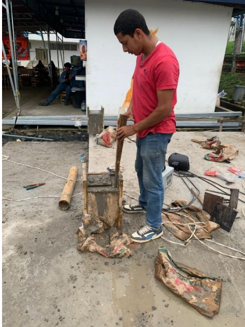
Ilustración 5 creación de los muñecos de concreto

Sugerencia general. – Se pueden ubicar fotos, formatos empleados, entre otros.