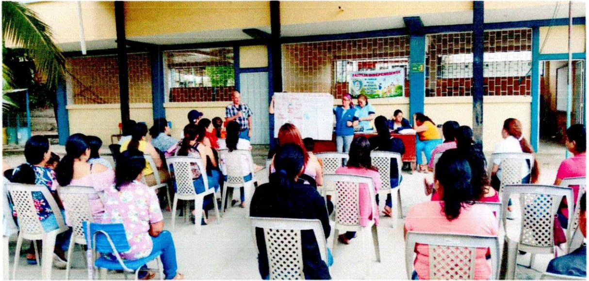
Docente impartiendo la charla sobre el taller.