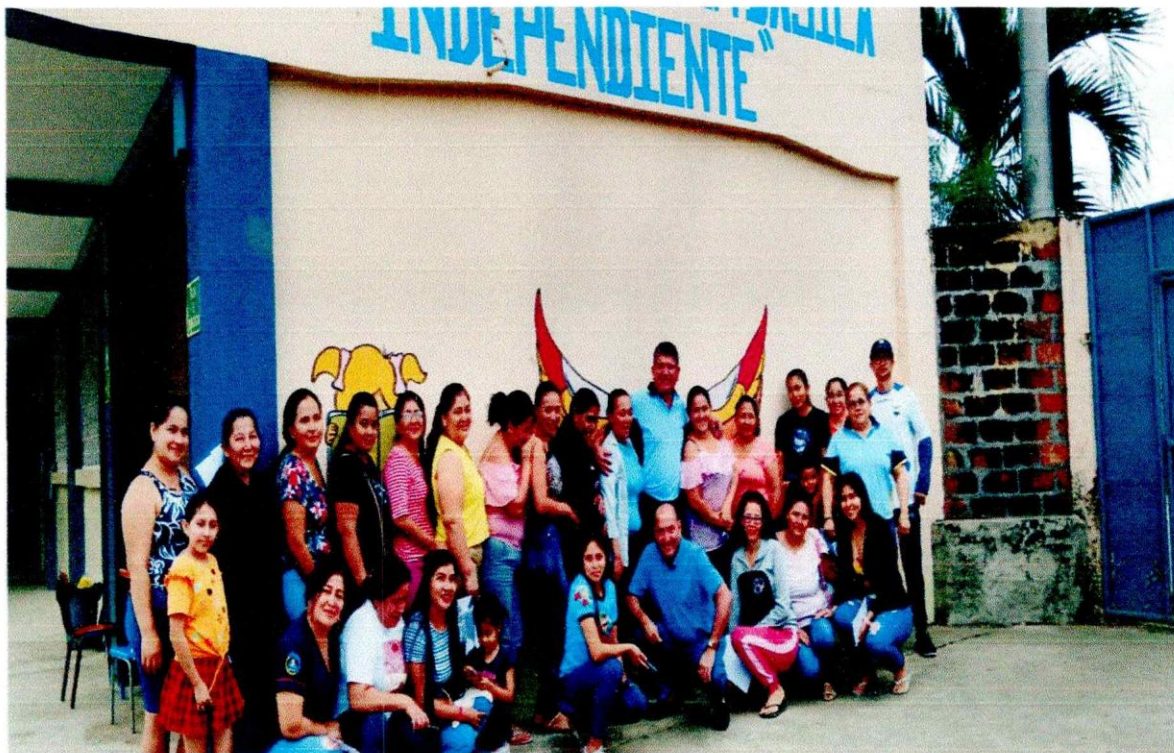
Los padres y las madres que participaron del taller.