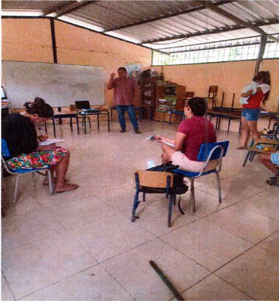
Taller de padres de familia