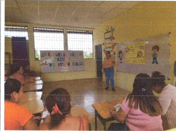
Docente impartiendo charla, previa al taller