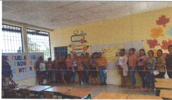
Padres y madres de familia participando del taller