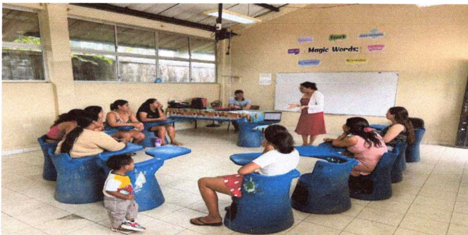
Docente dando a conocer la importancia de asistir al taller.