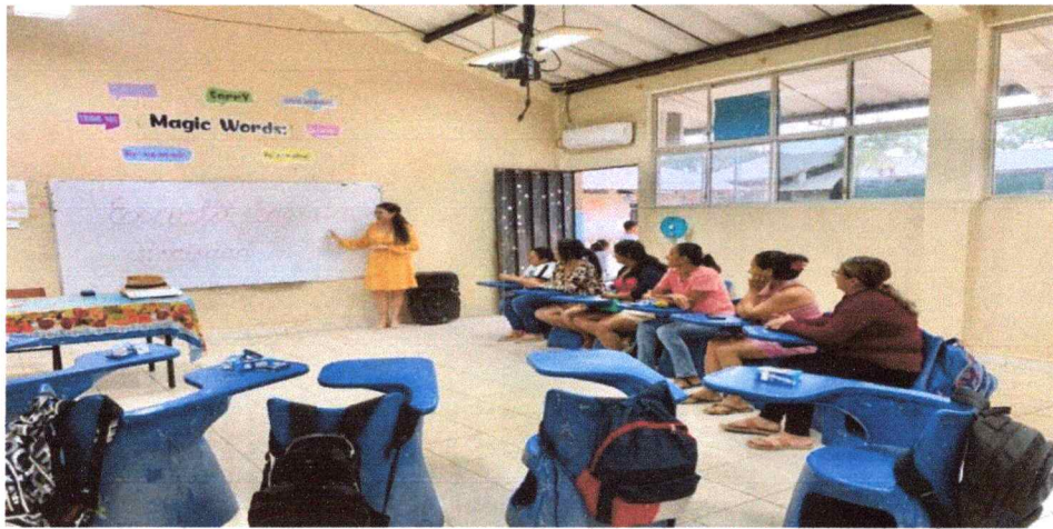
Docente, impartiendo el taller.