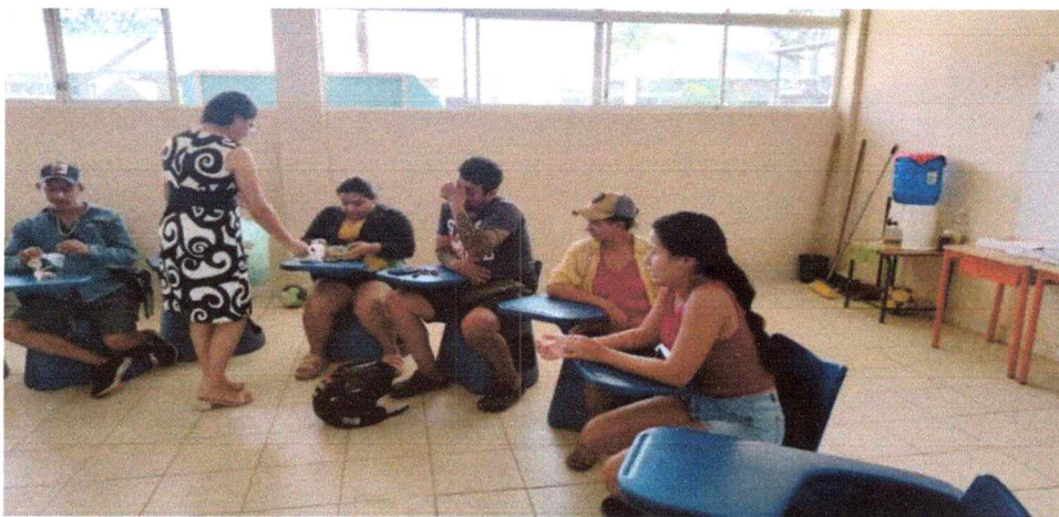
Docente evaluando a los padres de familia.