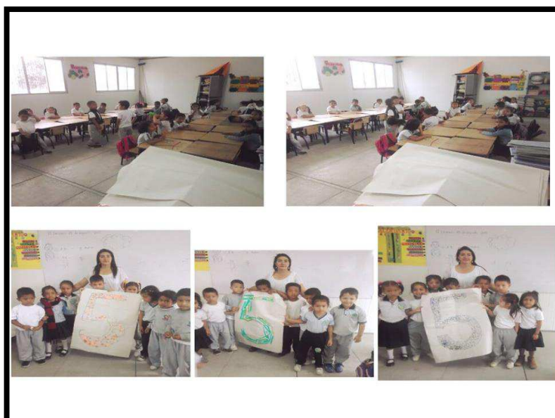
Niños y niñas del primer grado paralelo "D"