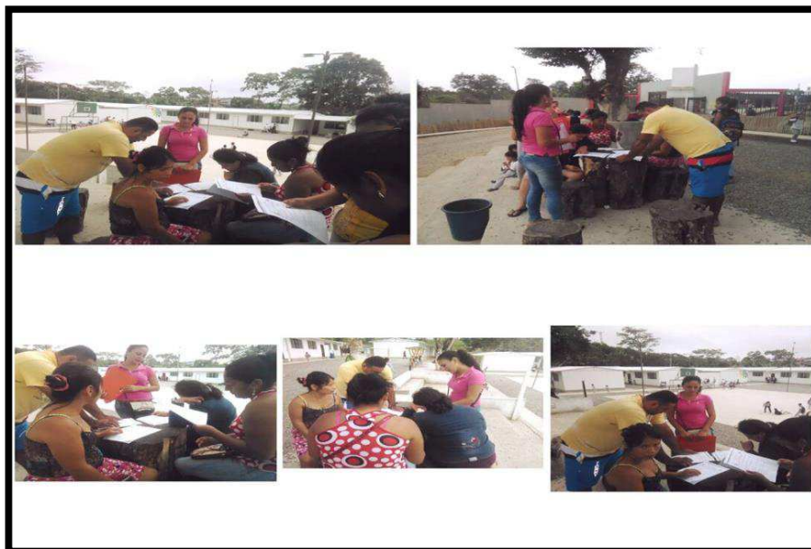
Encuesta a los padres de familia del primer grado paralelo "D"