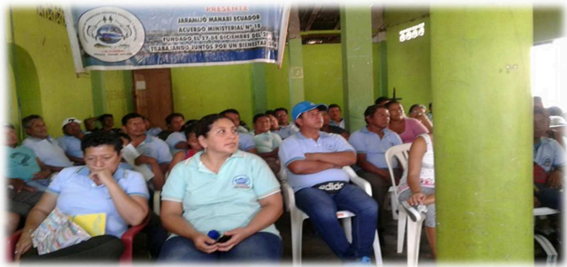
Atención de parte de los socios

Momento de la terminación con la explicación del tema del microtráfico por parte de los socios