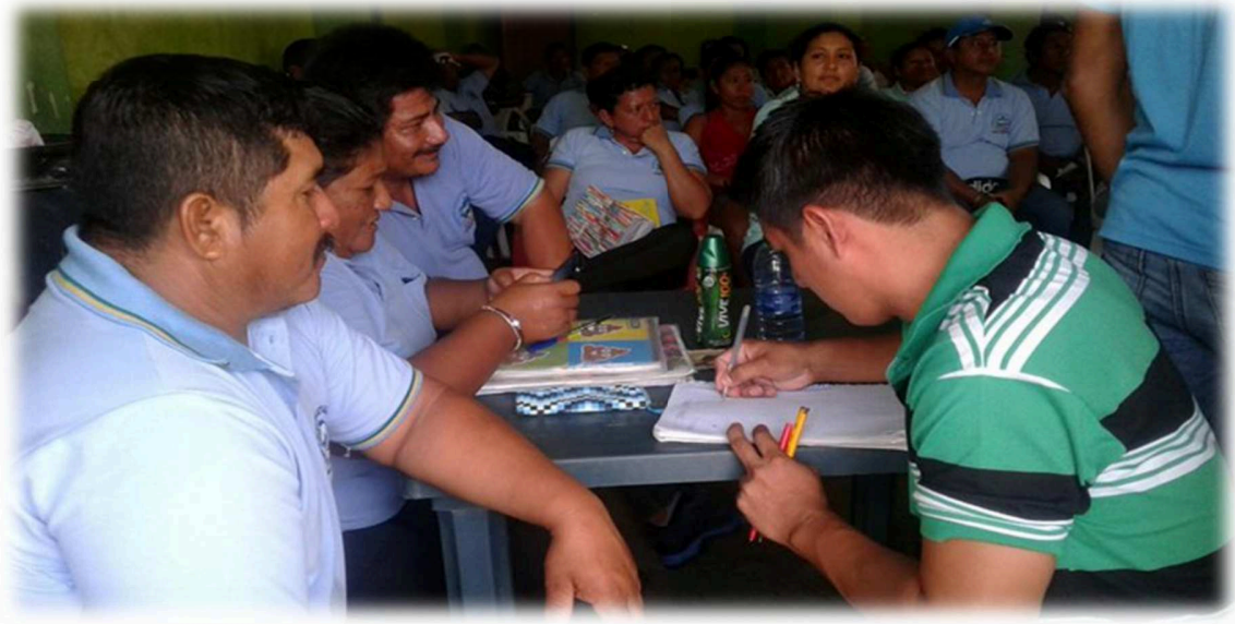
Momento de la intervención sobre el tema del microtráfico y su incidencia en el entorno familiar