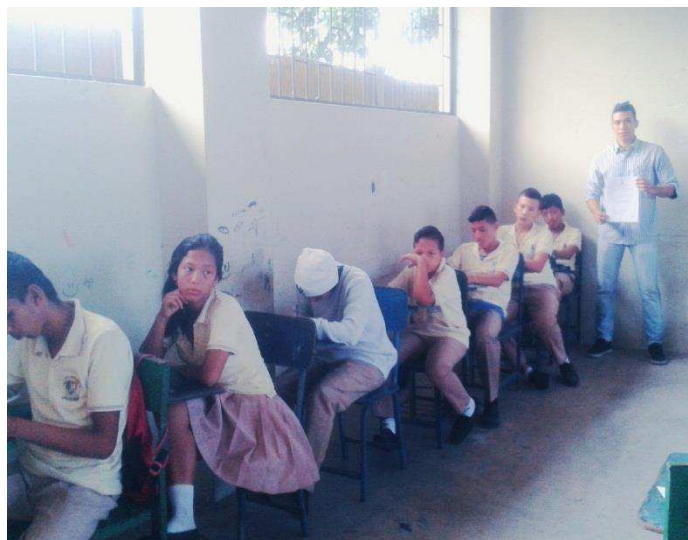
Foto 5: Periodo en que los estudiantes de octavo año responden a las preguntas planteadas referentes al tema tratado en la respectiva aula de clases.