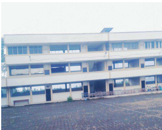
Foto 2: Parte interna de la Unidad Educativa "Hugo Cruz Andrade" de la parroquia 4 de diciembre del Cantón "El Carmen".