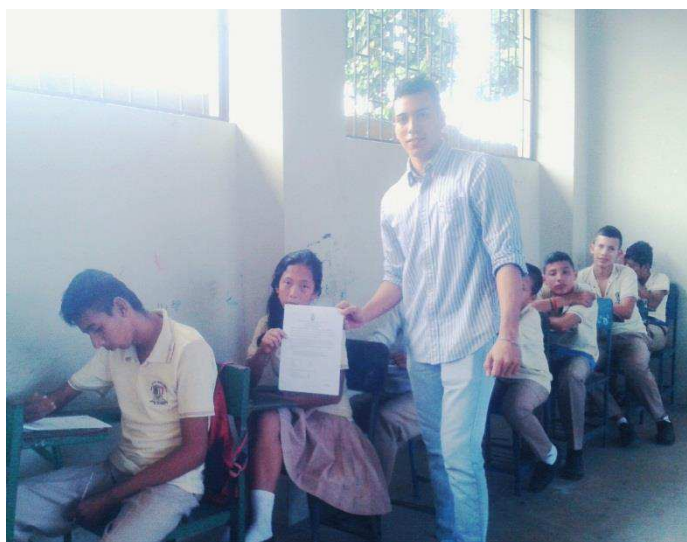
Foto 4: Instante en que se entregó la encuesta que consistía en una serie de preguntas referidas al tema de investigación a los estudiantes de octavo año de la Unidad Educativa “Hugo Cruz Andrade”.