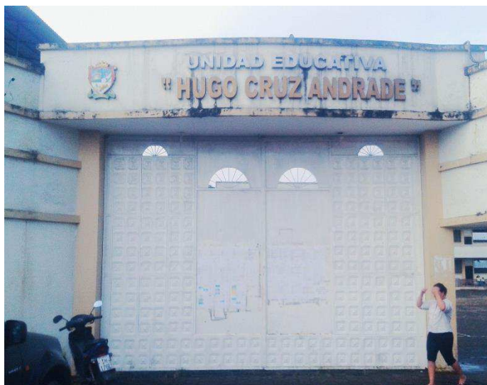
Foto 1: Parte externa de la Unidad Educativa "Hugo Cruz Andrade" de la parroquia 4 de diciembre del Cantón "El Carmen".