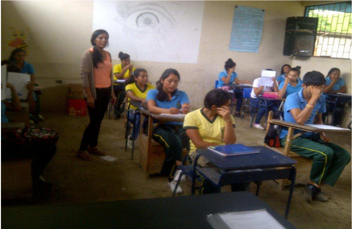
ENCUESTA APLICADA A LOS ESTUDIANTES DEL PRIMER AÑO DE BACHILLERATO