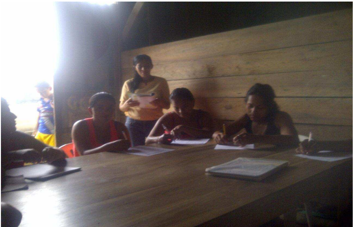
ENCUESTA APLICADA A LAS MADRES DE FAMILIA DEL PRIMER AÑO DE BACHILLERATO