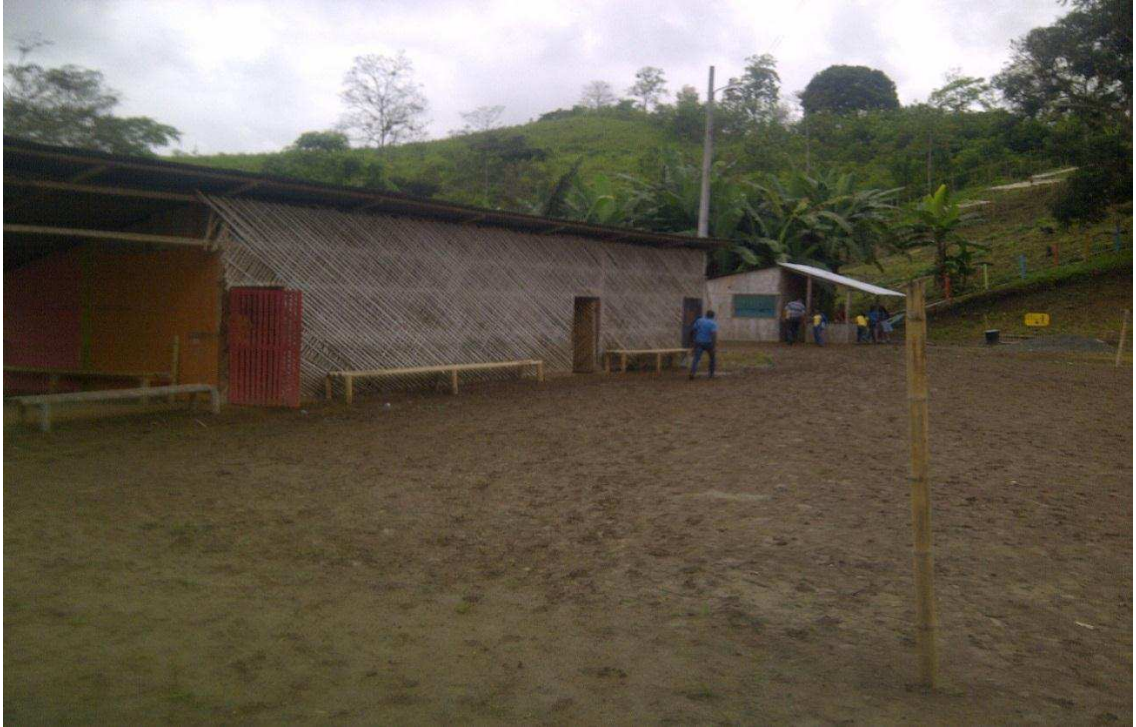
UNIDAD EDUCATIVA 20 DE MARZO