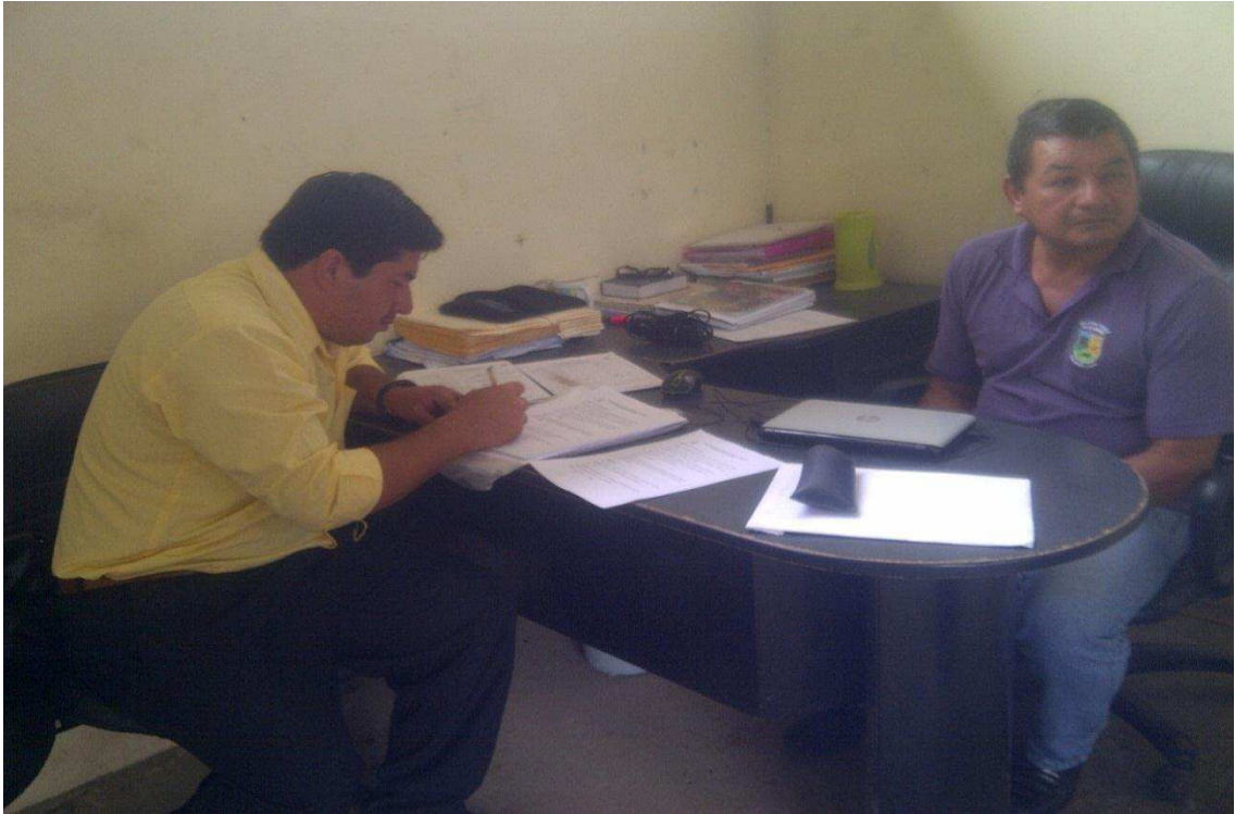
APLICACIÓN DE LA ENCUESTA DIRIGIDA A LOS DOCENTES DE LA INSTITUCION EDUCATIVA