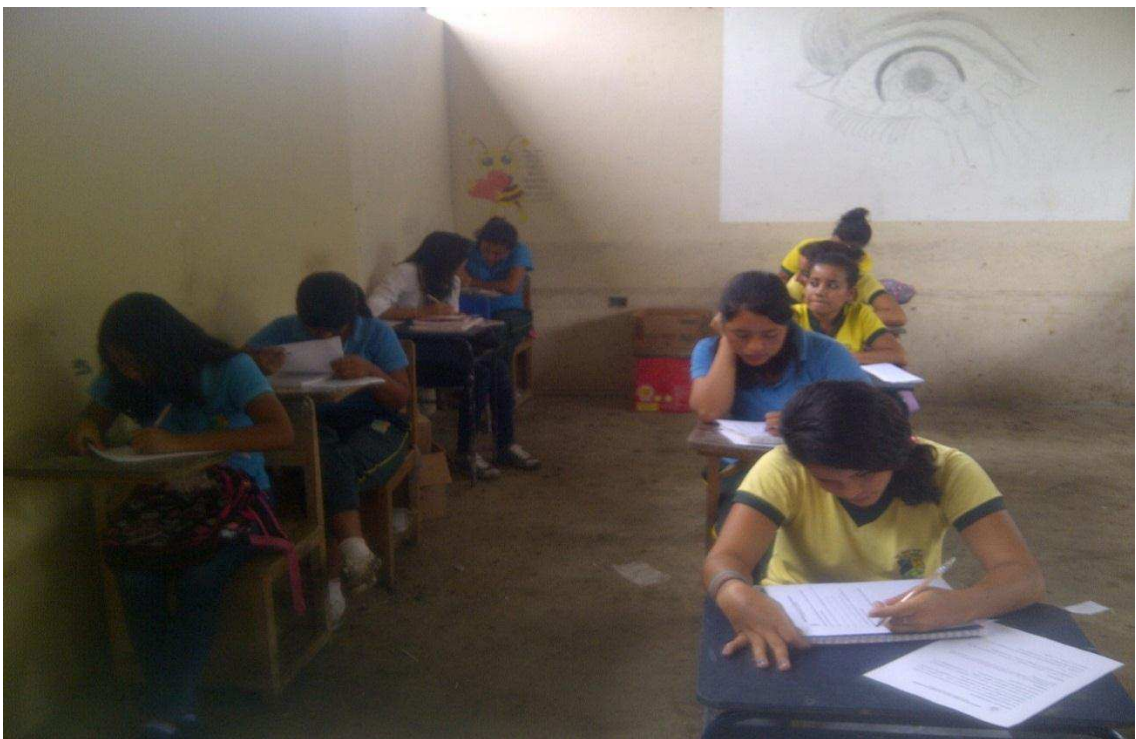
ENCUESTA APLICADA A LOS ESTUDIANTES DEL PRIMER AÑO DE BACHILLERATO