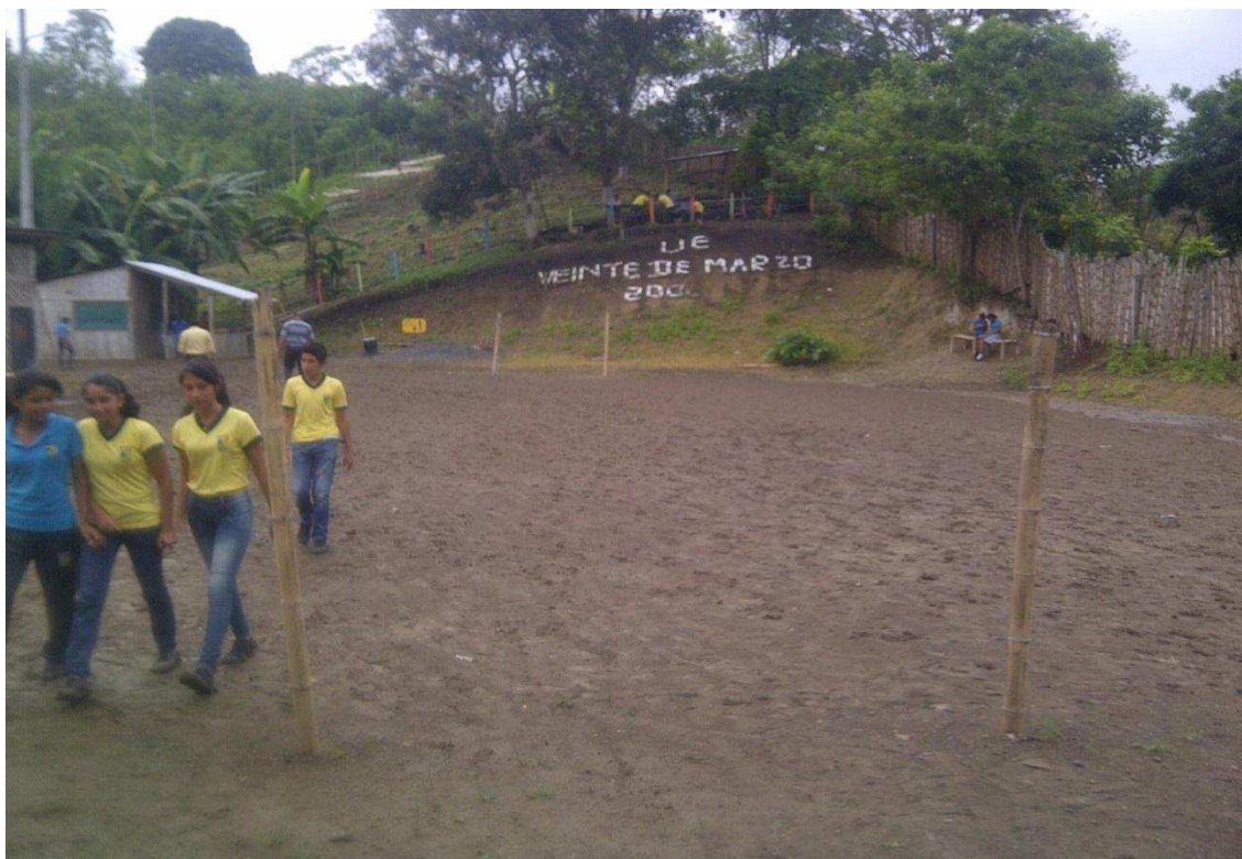
UNIDAD EDUCATIVA 20 DE MARZO