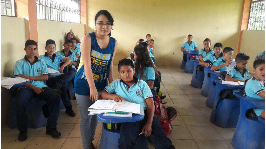
DYNAMIC EXPRESSION SWITH STUDENTS.