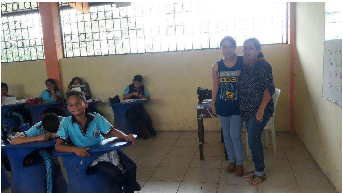
A FRATERNAL HUG WITH THE FOREIGN LANGUAGE TEACHER FOR THAT UNCONDITIONAL SUPPORT.