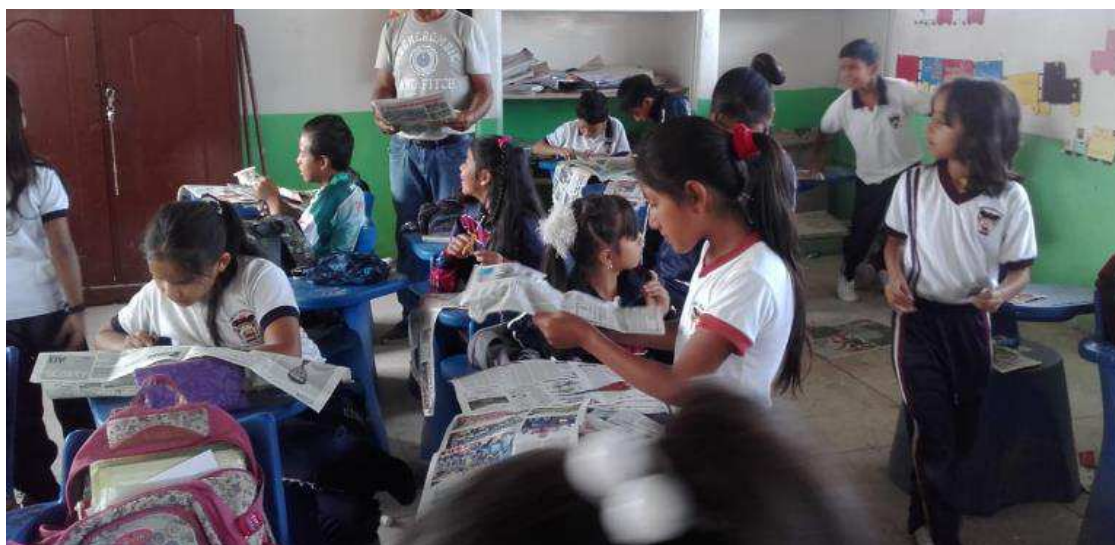
Técnica: Guía de Observación