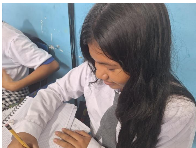
Alumna realizando la actividad.