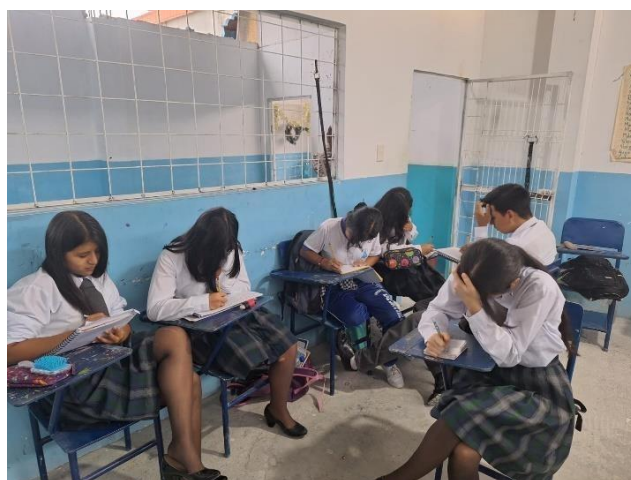
Varios de los participantes realizando sus escritos