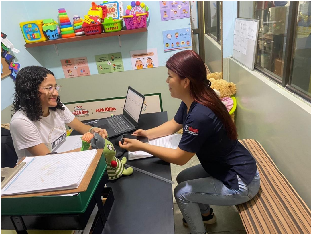
Anexo 2. Entrevista a Psicóloga de la Fundación Shekinah