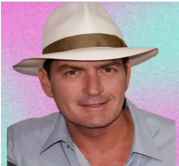
Figura 2 Entre los famosos que han usado los sombreros de paja toquilla de Pile, está Charlie Sheen.

Nota: Sheen que pagó $25.000 por este accesorio.