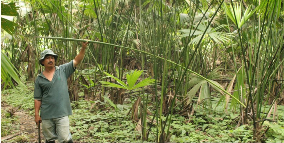
Figura 5 Agriculteur récoltant la paille toquilla. Manabí-Equateur