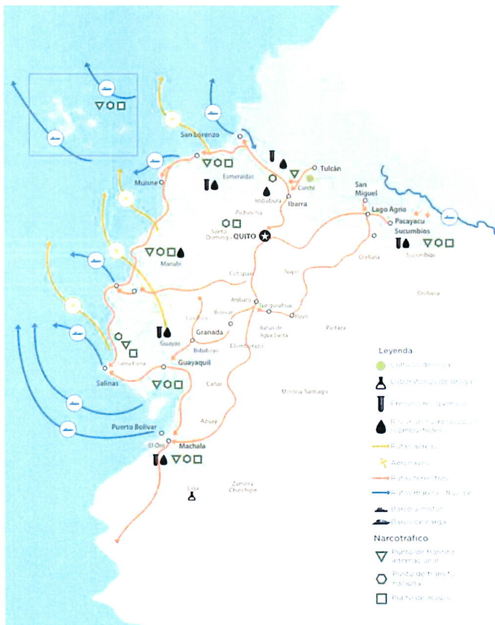
Gráfico 2. Rutas terrestres, marítimas y aéreas de ingreso y salida de droga

Nota. Información obtenida del observatorio ecuatoriano de crimen organizado (2019)