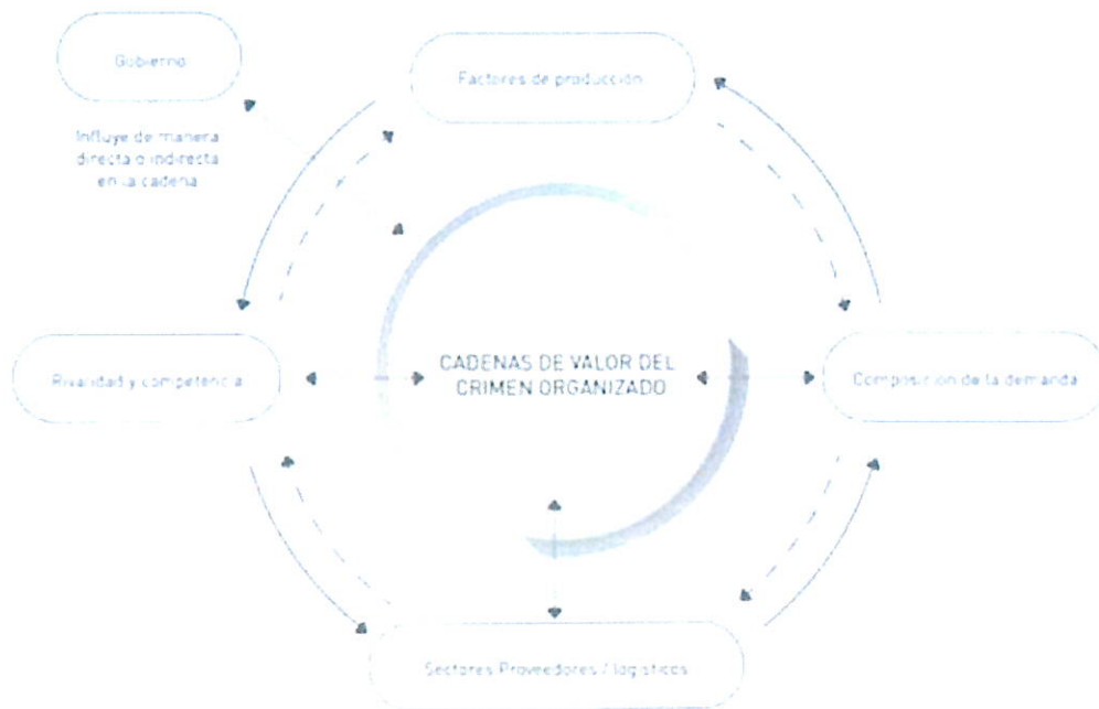
Gráfico 1. Flujograma de las cadenas de valor del COT

Nota: Información obtenida de la Revista Latinoamericana de Estudio de seguridad (2020)