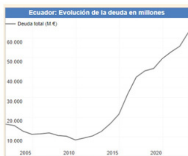
Figura 2. Evolución deuda externa en millones de dólares. Ecuador, 2000-2022. (Datosmacro-BCE, 2024)