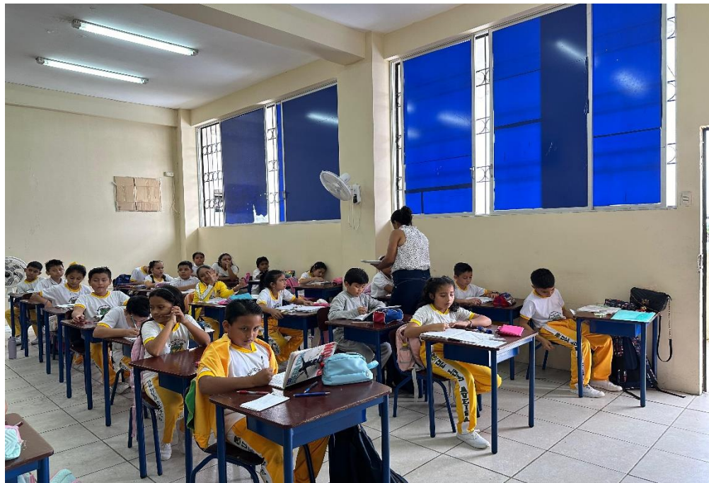
Nota: Estudiantes de quinto grado de la Unidad Educativa Luis Aveiga Barberán