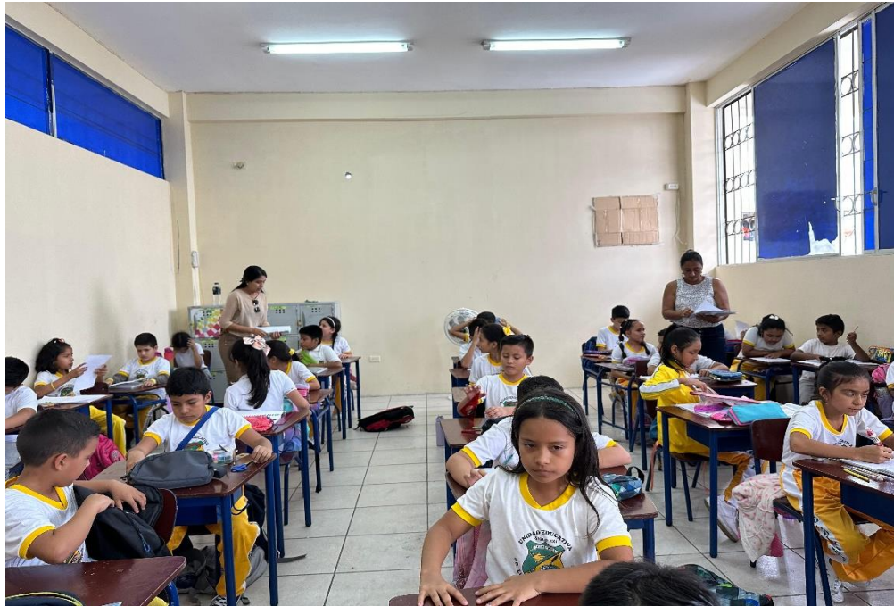
Nota: Estudiantes de quinto grado de la Unidad Educativa Luis Aveiga Barberán