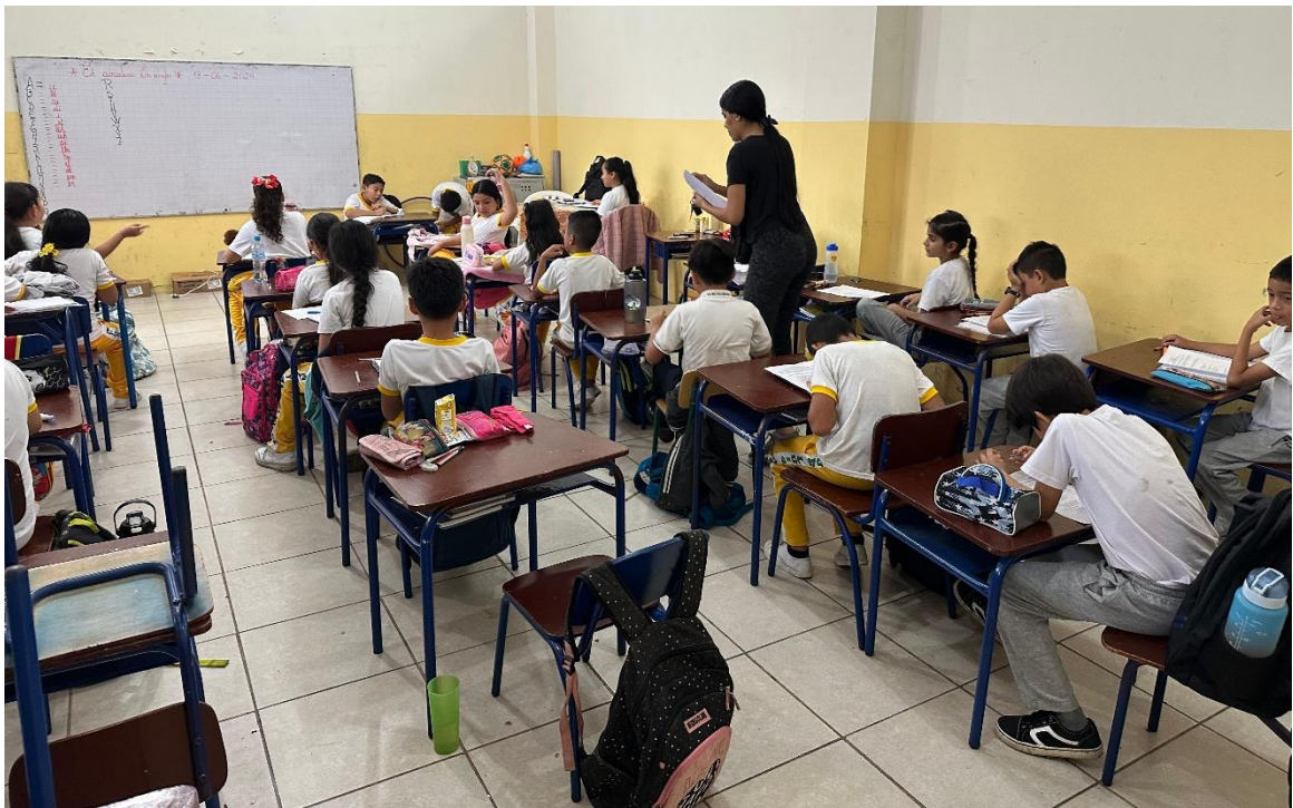
Nota: Estudiantes de quinto grado de la Unidad Educativa Luis Aveiga Barberán