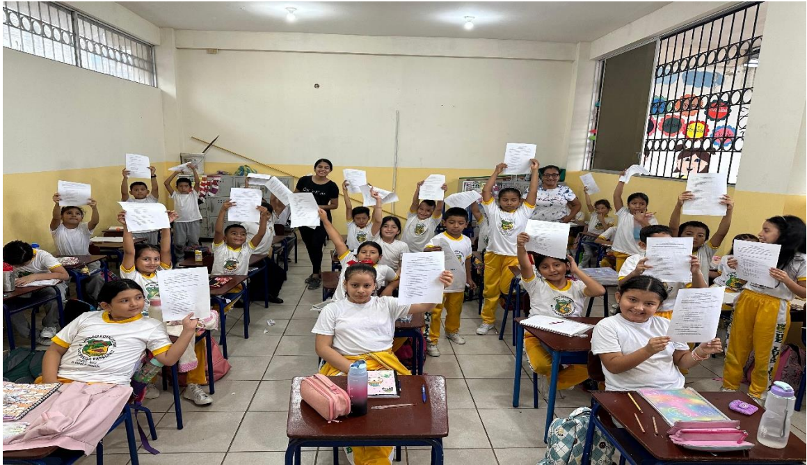
Nota: Estudiantes de quinto grado de la Unidad Educativa Luis Aveiga Barberán