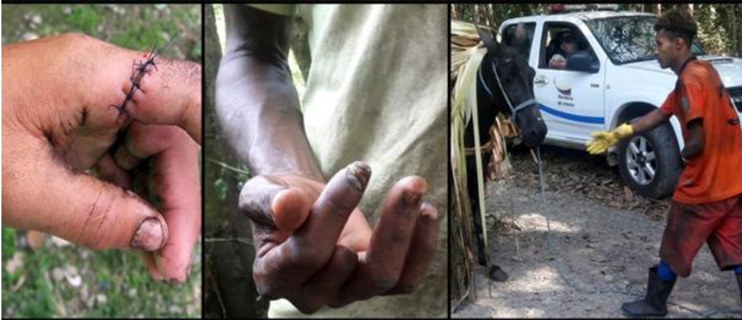
Imagen 4: Accidentes laborales en tierras de Furukawa.