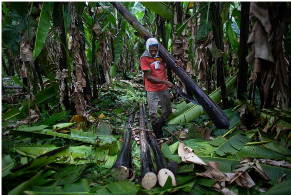
Imágenes 5 y 6: Abacaleros trabajando sin la indumentaria correspondiente.