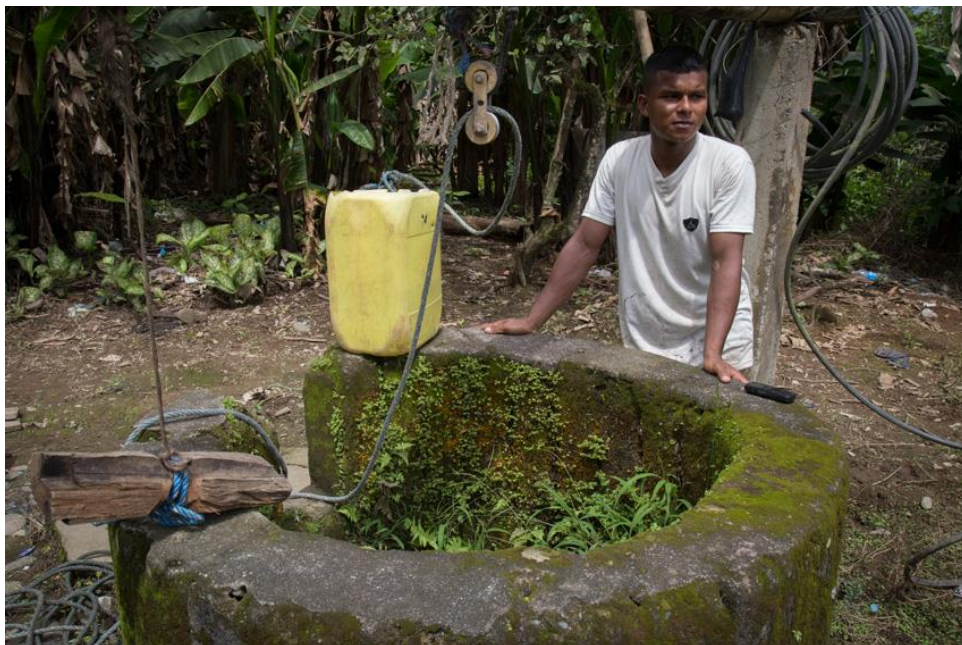
Imagen 3: Pozo de agua sin recibir mantenimiento por más de un año. Los abacaleros se abastecían de ese líquido.