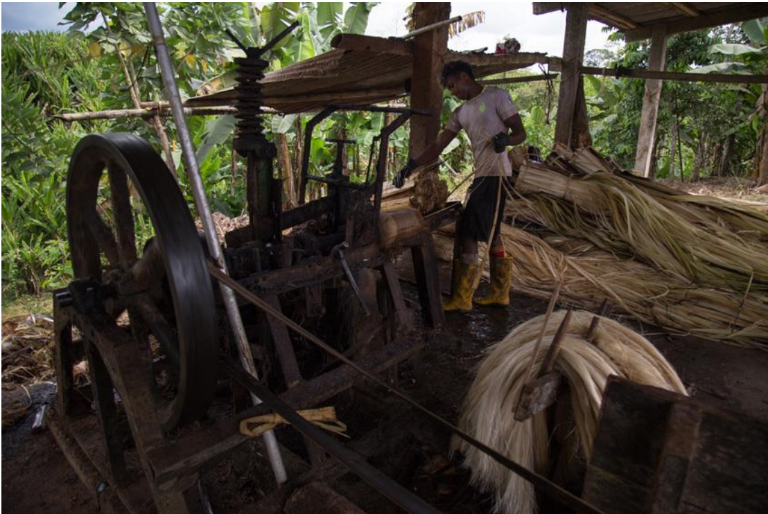
Imagen 1 y 2: Maquinaria perteneciente a la empresa Furukawa, importada desde Japón y la India y sin ser reemplazada por más de 50 años.