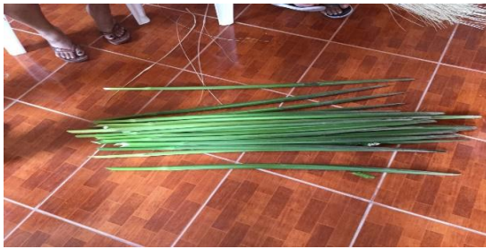
Ilustración 2: Proceso de elaboración del sombrero de paja toquilla