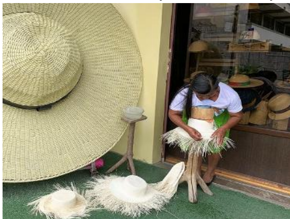
Ilustración 3. Producto final, sombreros finos de paja toquilla, Montecristi