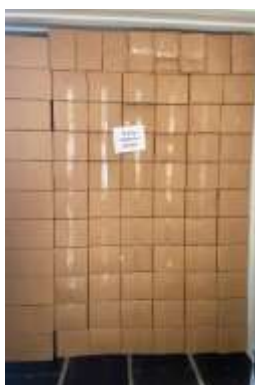
Ilustración 5.- Producto dentro del contenedor