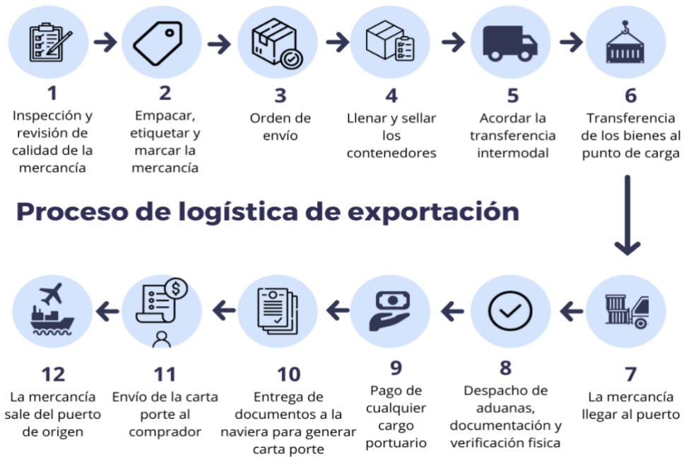
Ilustración 1: La figura representa los pasos logísticos que se siguen para llegar a una exportación, estos engloban los procesos tanto de forma marítima como aérea como se muestra en el paso número 12 (Mercados, 2023).